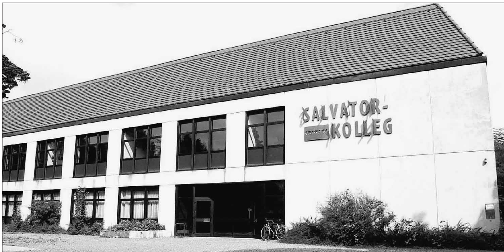
Vor 32 Jahren erbaut, soll das Salvatorkolleg von 2009 bis 2013 eine gründliche Sanierung erfahren. Das hat der Wurzacher Gemeinderat am Montagabend beschlossen.

Fünf Jahre sind insgesamt veranschlagt, von 2009 bis 2013 wird das Kolleg, zumindest zeitweise, zur Baustelle. Wie die Pläne im einzelnen aussehen, erläuterte Michael Luib vom Bauamt dem Gemeinderat. Begonnen werden soll 2009 im Dachgeschoss mit der energetischen Erneuerung der Fenster und Alu-Außenteile und der Dachsanierung. Außerdem sollen neue Bodenbeläge verlegt und Klassenzimmer und Fachräume auf den Stand der Technik gebracht werden. Drei neue Klassenzimmer sollen im Dachgeschoss entstehen und Raum schaffen für die späteren Umbauten im Erdgeschoss. „Drei weitere sind ge-