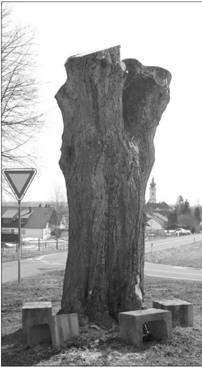
Diese Linde spendet wenig Schatten