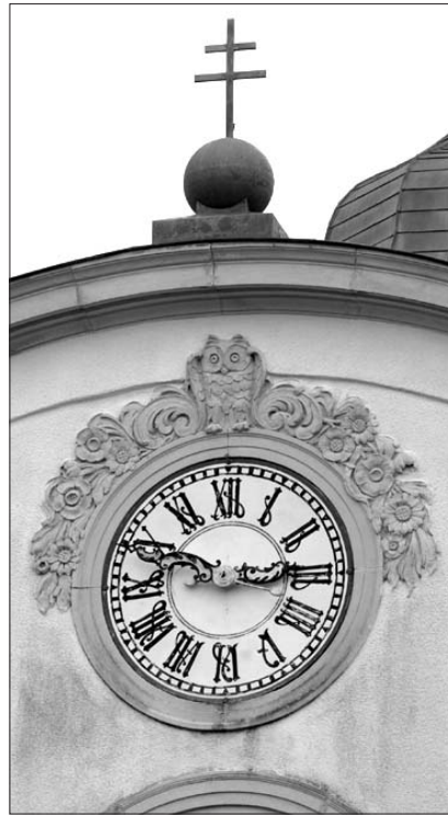
Die Zeit steht – aber nicht mehr lange.