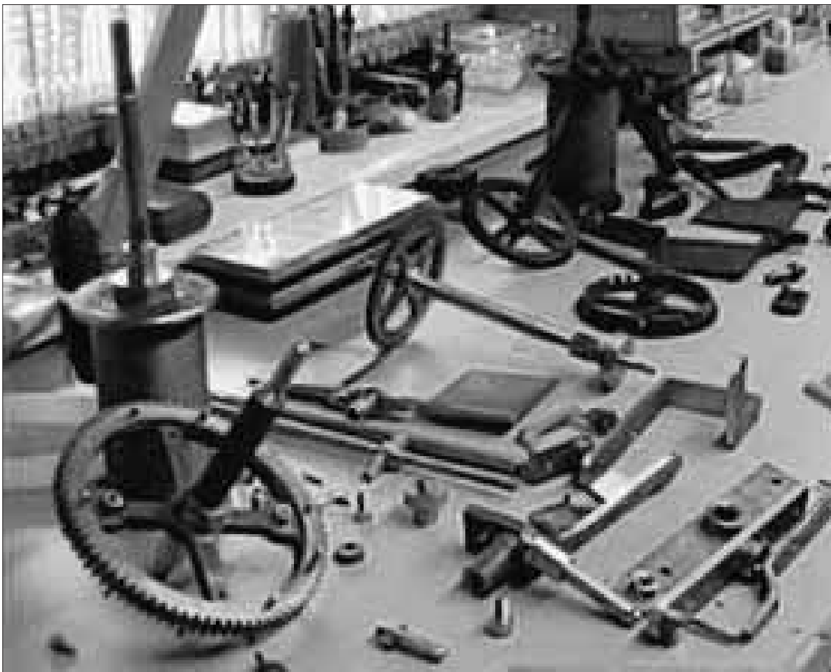
Die Uhr der Drümmelberg-Schule ist in der Bad Wurzacher Uhrmacher-Werkstatt in seine Einzelteile zerlegt und gesäubert worden.